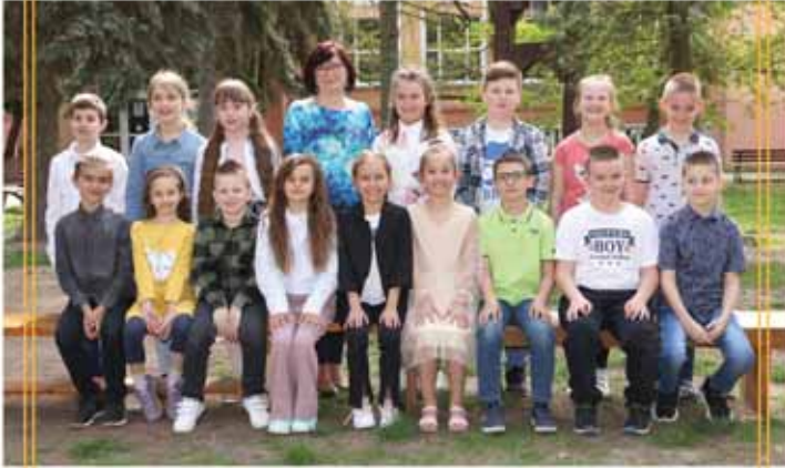
III. osztály 2022/2023