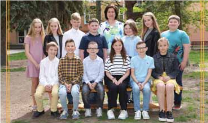
IV. osztály 2022/2023