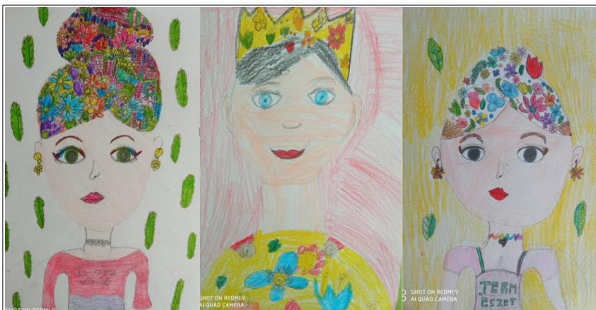
Válogatás a 3. osztályosok munkáiból

Szeretem őt, mert mindent együtt csinálunk: olvasunk, játszunk, bohóckodunk. Jó vele beszélgetni, soha nem csalódtam benne, sem a tanácsaiban, sem pedig az ötleteiben. Igaz, nem mindig hallgatok rá, de a végén belátom, neki volt igaza. Ha felnövök, szeretnék olyan lenni, mint ő. Anyukám a legjobb. Nagyon szeretem őt.