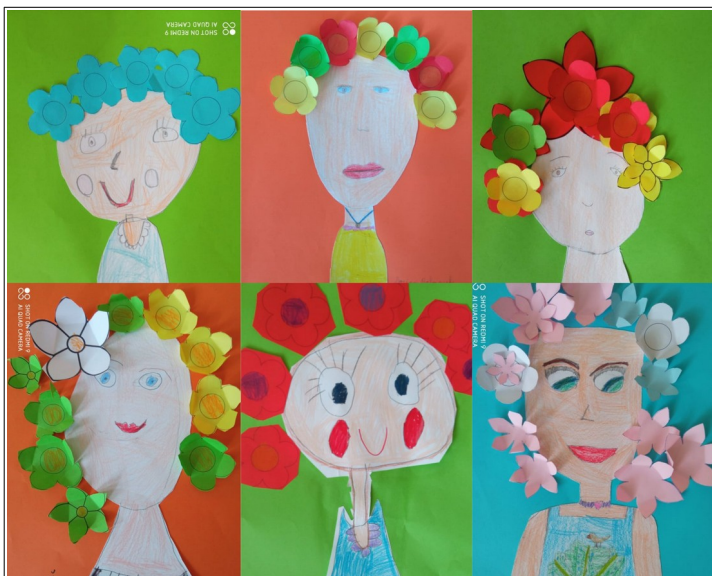
Válogatás a másodikosok munkáiból

Az a kedvenc részem, amikor még nincs megsütve és kóstolhatok a nyers tésztából... ja, és a vége, amikor megehetem. Most leírom az elkészítést is: